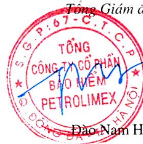
Đào Nam Hải