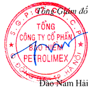
Đào Nam Hải

Các thuyết minh đính kèm là bộ phận hợp thành của báo cáo tài chính hợp nhất này